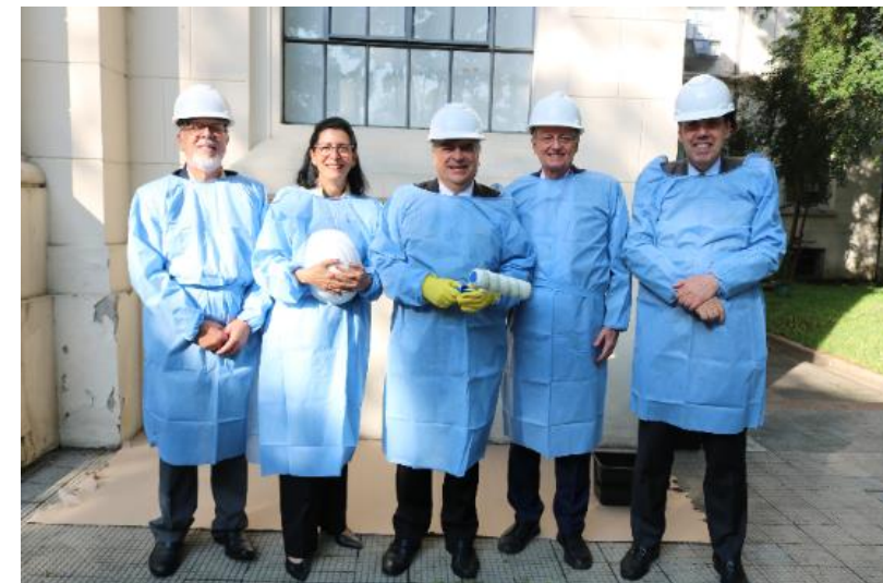
Cerimônia de Restauração da Fachada